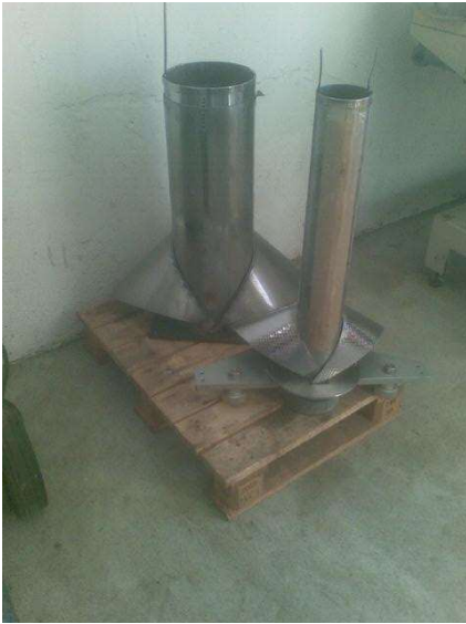
Figur 1 Forming tube for. Hassia-Redatron bagger with hot air vertical sealing

Brugt Formatsæt til HASSIA – REDATRON Sbags med hot air vertikal sealing system for posebredde 350 mm. Pris ex. Moms. og montering: kr. 3.200,-