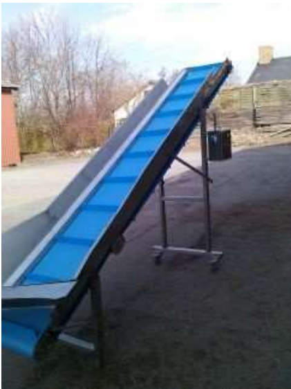
Elevatorbånd 450 x 4000 mm til våde Fødevarer m. 48 mm medbr.

Brugt Formatsæt til HASSIA – REDATRON Sbags med hot air vertikal sealing system for posebredde 350 mm. Pris ex. Moms. og montering: kr. 3.200,-